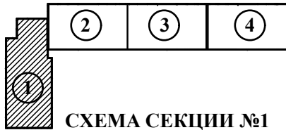
СХЕМА СЕКЦИИ №1 (1 этаж)